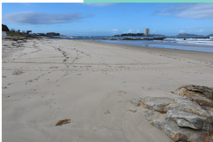
Praia da Foz