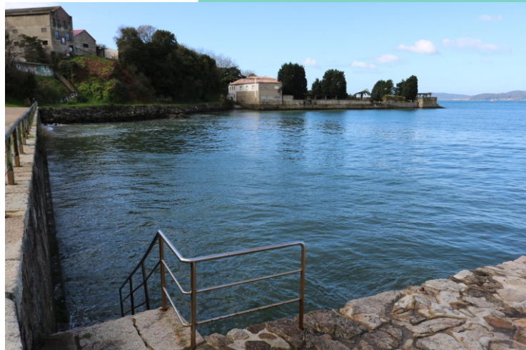
Enseada de Bouzas e punta Fiunchal.