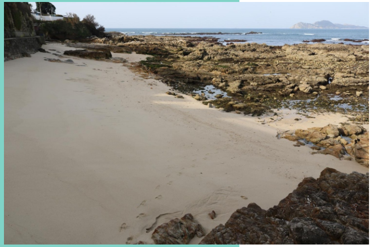
Praia da Buraca e punta Serral ou Suadecostas