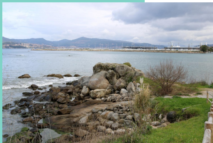
Punta da Cruces.