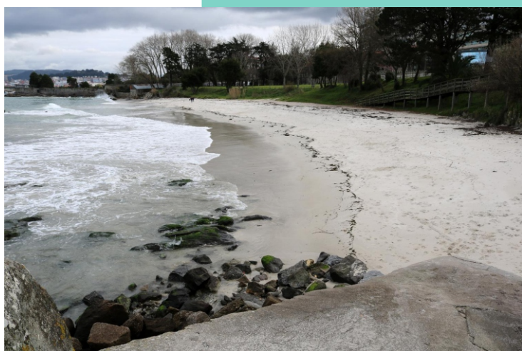
Praia do Carril