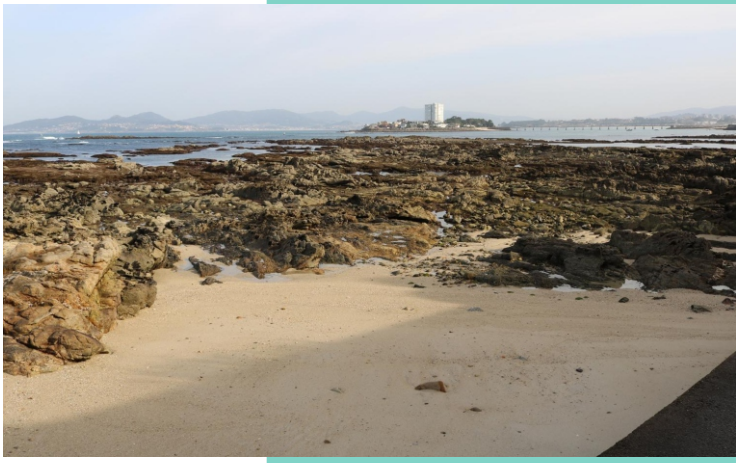
Punta da Sobreira