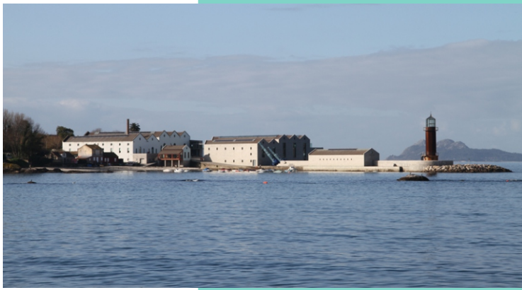
Punta do Muíño. Museo do Mar de Galiza, un centro cultural e científico dedicado ao mar, inaugurado en xuño do 2002. No recinto acolle os restos do castro de Alcobre.