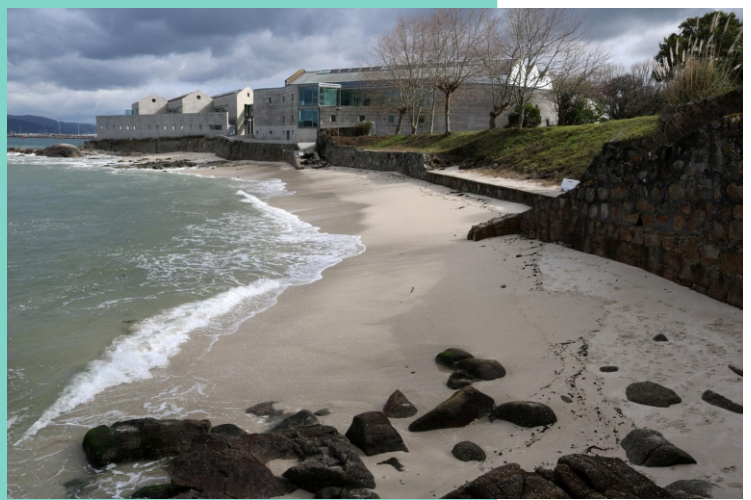
Praia da Mourisca.