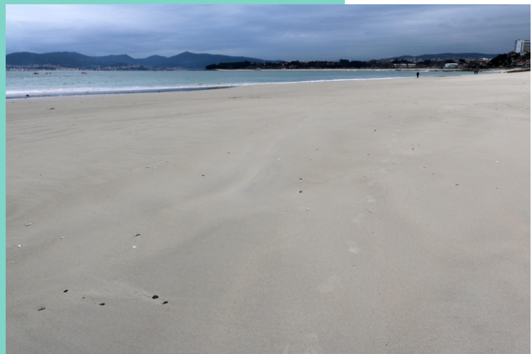
Praia do Vao