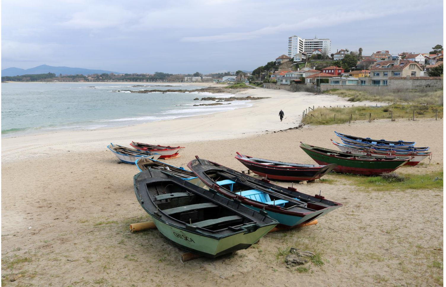
Praia da Fontaíña ou da Sereiña