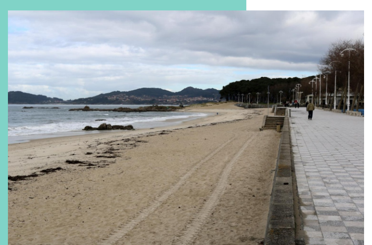
Praia Azul ou Argazada