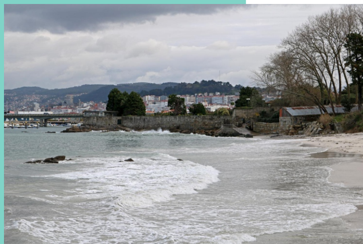
Punta Fiunchal e praia do Carril