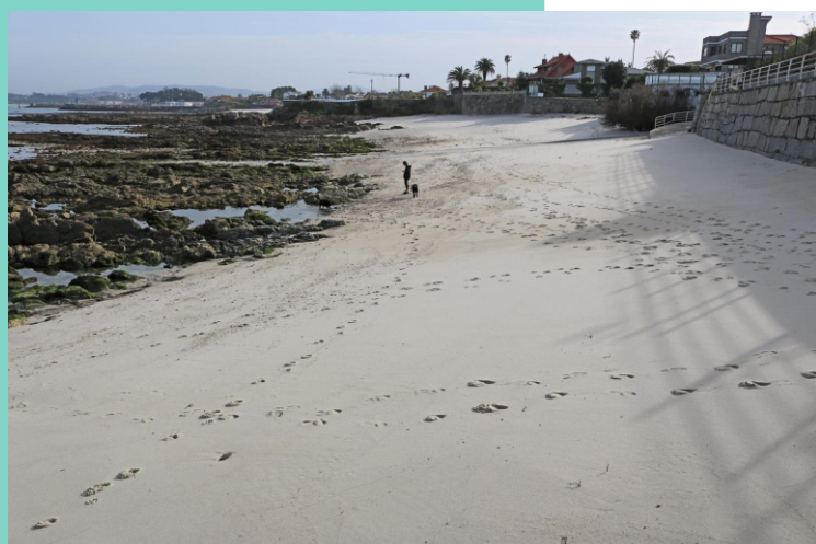
Praia e punta da Sobreira