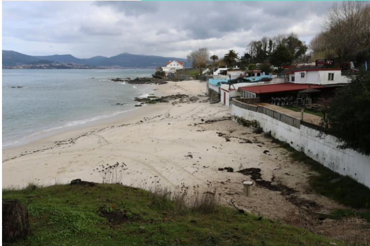
Praia de Fontes