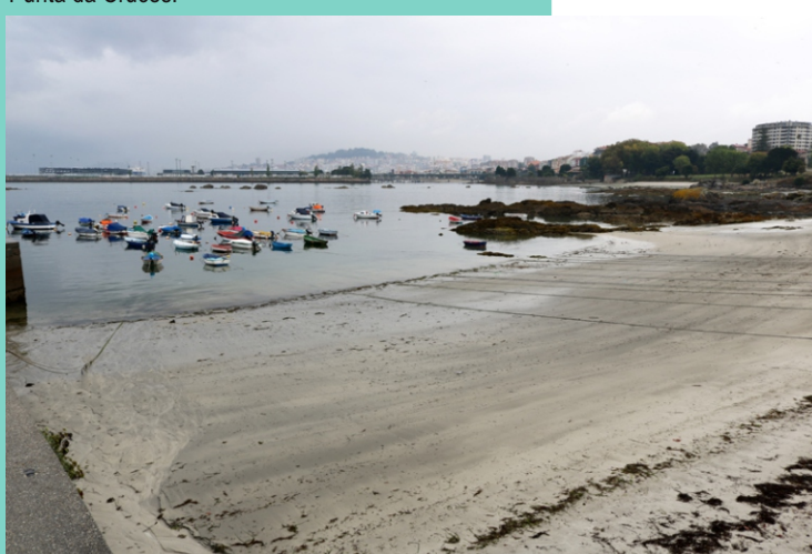
Praia do Cocho.