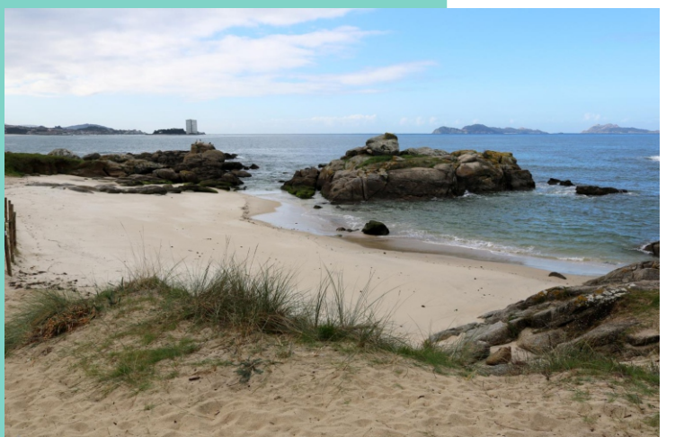
Praia do Cocho das Dornas