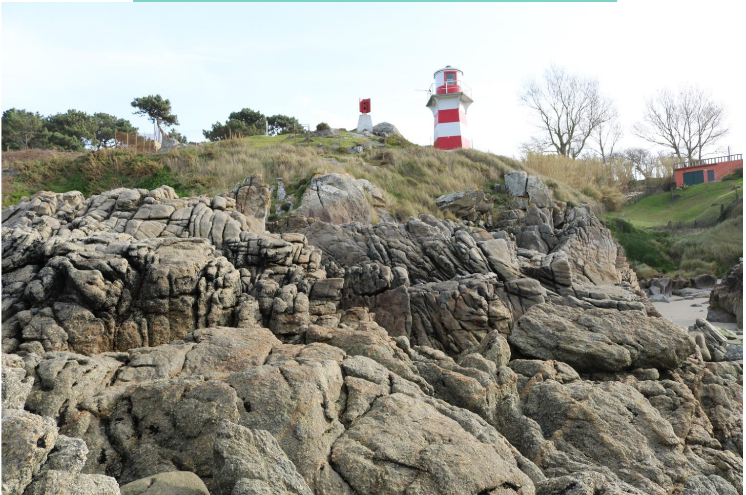
Cabo Estai e praia da Furna