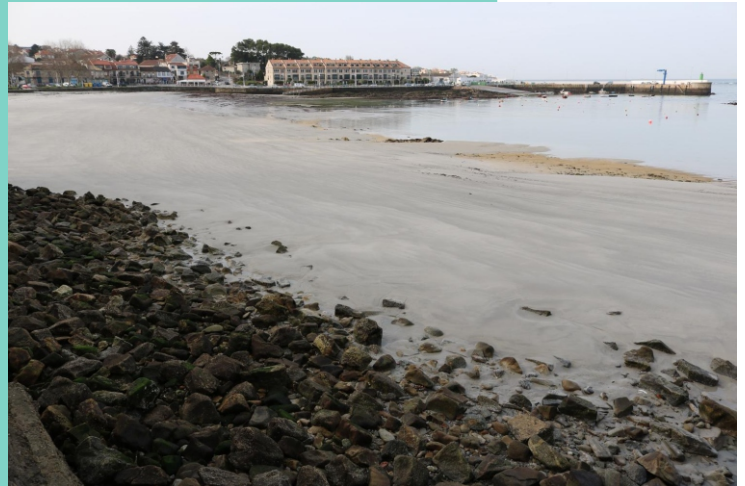
Praia de Canido ou Canto de Area