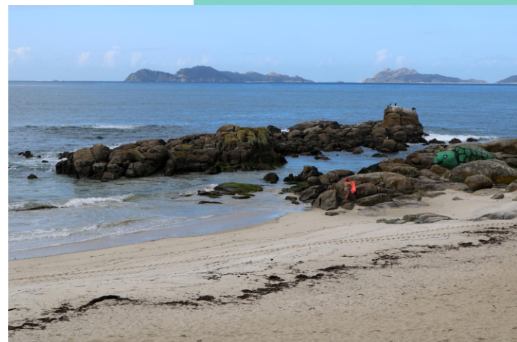
Cabo do Mar ou punta de Samil