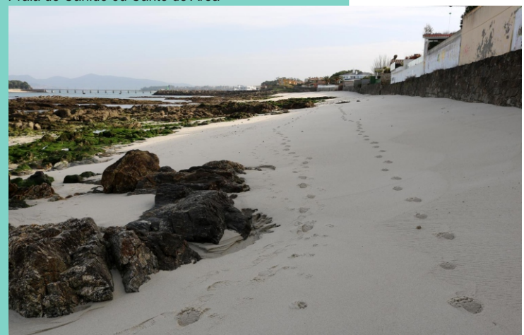
Praias de Xunqueiro, Barxa de Oia, Cagadeira e Soutelo