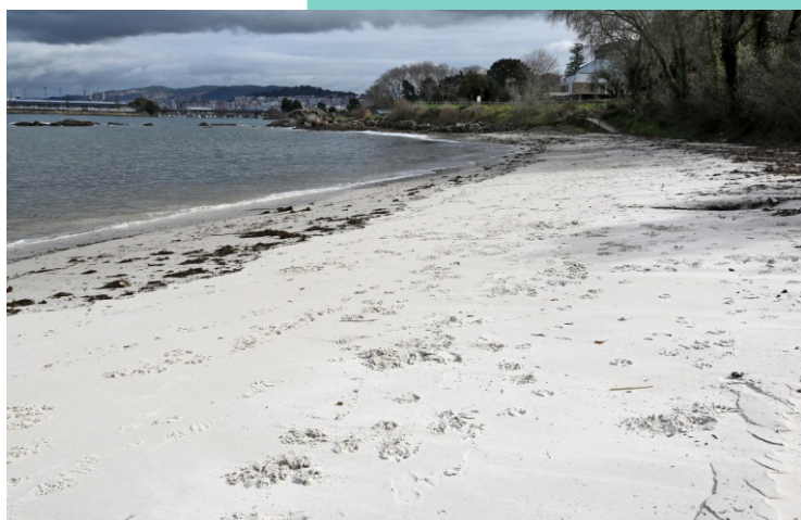
Praia de Santa Baia.