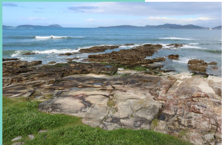
Praia de Fuchiños ou Feciña