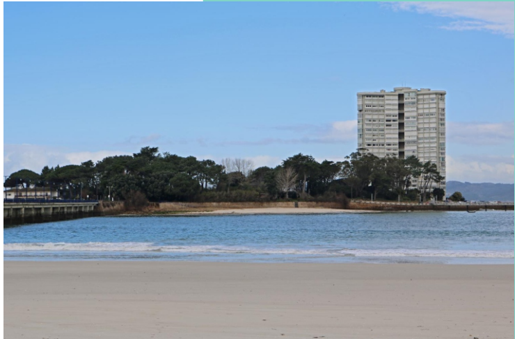
-Illa e praia de Toralla