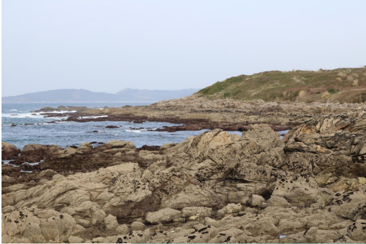
Cabo Estai. A Laxe.