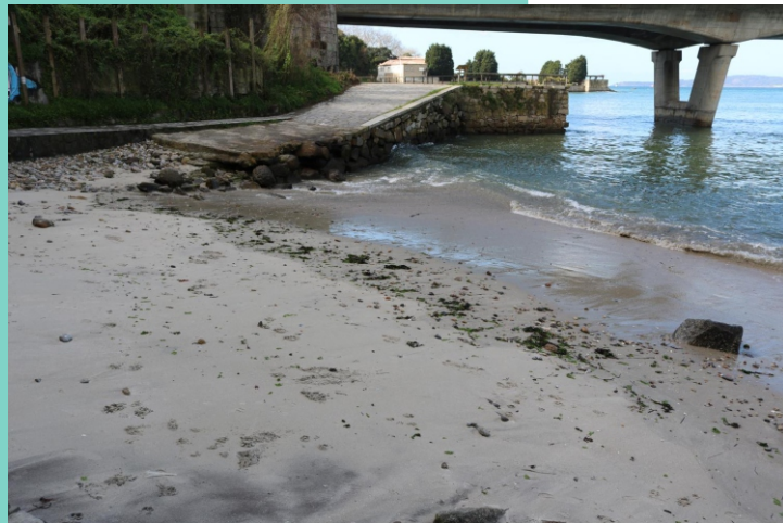
Praia da Fontoura