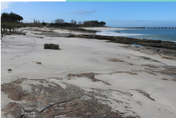
Praia Baluarte ou Breadouro. Punta Elena.