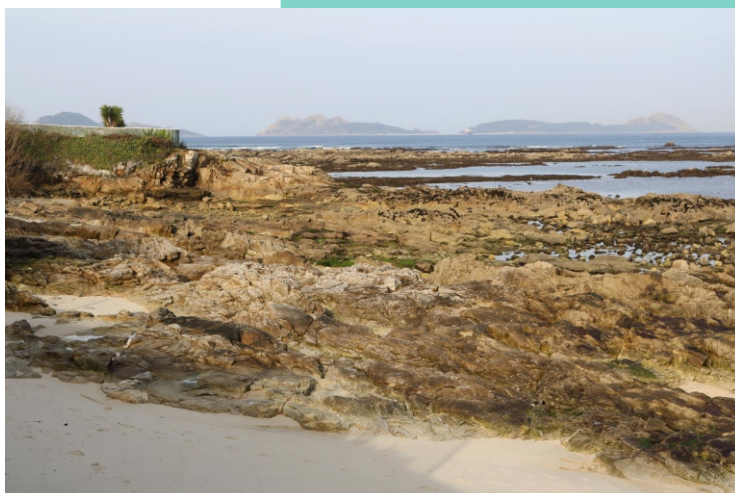
Punta Marosa ou do Tendal