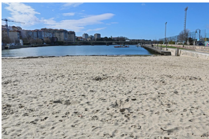
Praia do Adro