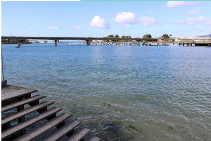
Enseada de Bouzas.