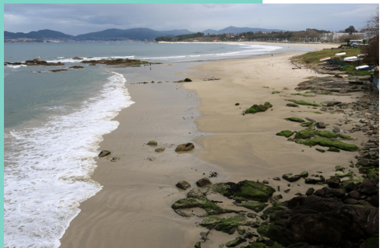
Praias da Calzoa ou As Barcas