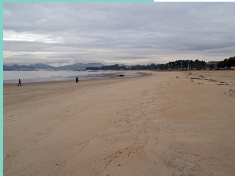
Praia de Samil, un areal de 1.700 m de lonxitude. A súa proximidade ao centro de Vigo convértea na máis concurrida e mellor dotada de servizos. No inverno é un bo lugar paseo.