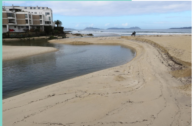
Desembocadura do río Lagares.

O Río Lagares nace nos montes no Coto Ferreira e desemboca na Ría de Vigo, entre as praias de Samil e A Foz. Na parte baixa do curso existe un sendeiro que se pode percorrer a pé ou en bicicleta.