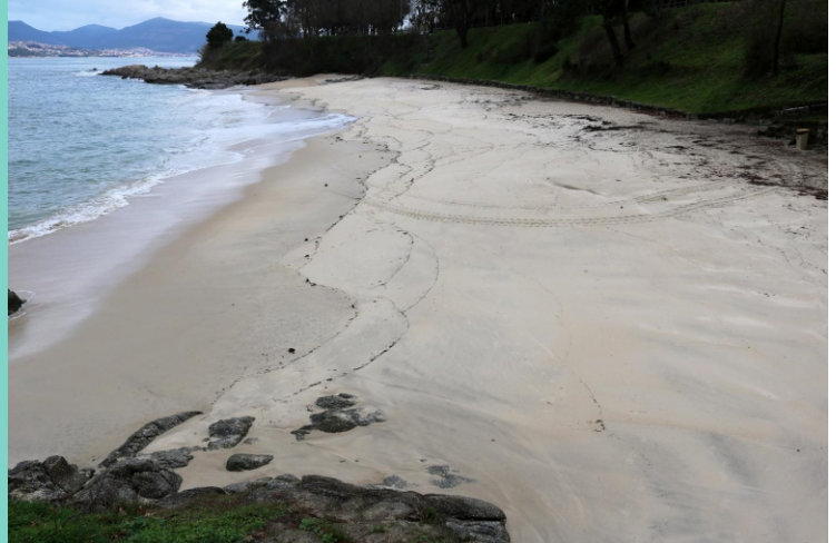
Praia do Pincho do Gato